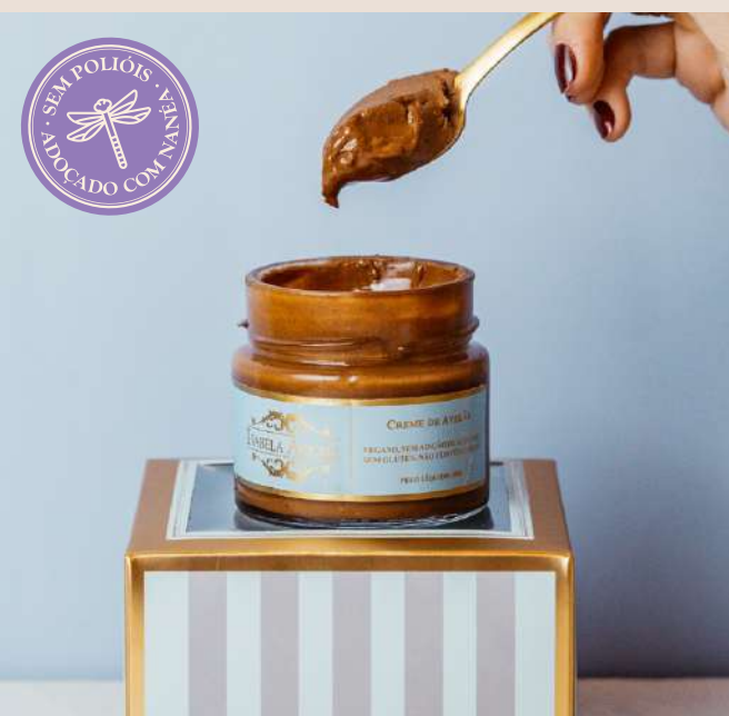
CREME DE AVELÃS