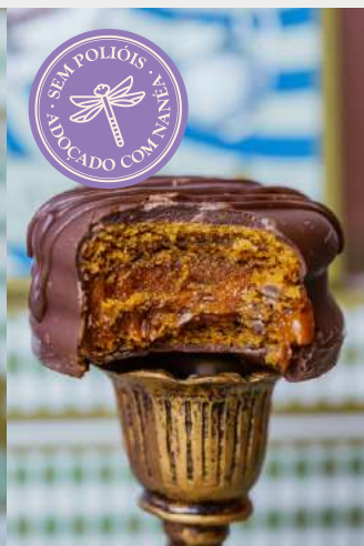
ALFAJOR TRADICIONAL DE DOCE DE LEITE