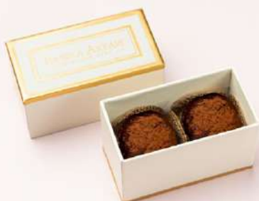
Dupla de Brigadeiro Tradicional