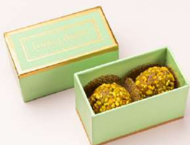
Dupla de Brigadeiro Pistache