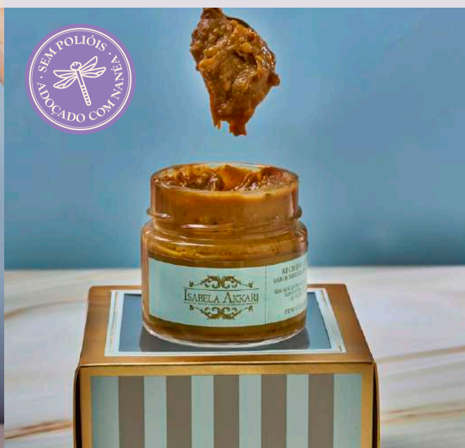
BRIGADEIRO DE PISTACHE