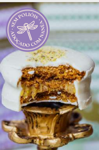
ALFAJOR BRANCO DE BRIGADEIRO DE PISTACHE