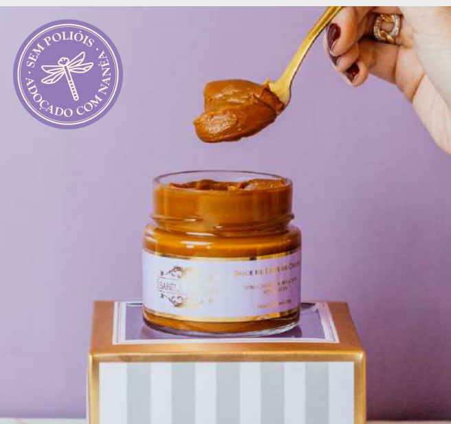
DOCE DE LEITE

Sem adição de açúcares, sem polióis (adoçado com NANÉA: fibra isolada da tapioca e stévia), sem glúten, sem lactose (contém caseína). Contém derivados de soja.