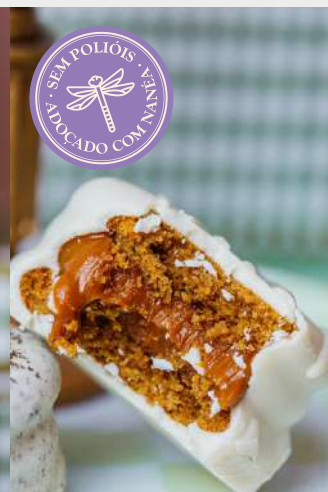
ALFAJOR BRANCO DE DOCE DE LEITE