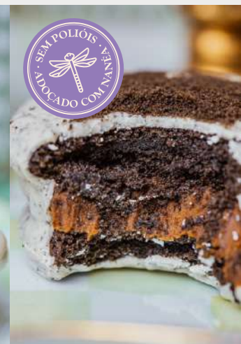
ALFAJOR BRANCO DE COOKIES & CREAM COM RECHEIO DE BRIGADEIRO